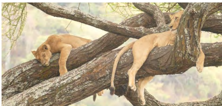
Baumlöwen im Lake Manyara National Park

Safari und Kipepeo: Was wäre ein Besuch in Tansania ohne Safari. 4 Tage haben wir die unfassbare Vielfalt an Tieren und Pflanzen erlebt sowie beeindruckende Landschaften erkundet. Und auch den traditionellen Abschluss im Kipepeo Beach Village, Kigombani Beach, Indischer Ozean, konnten wir genießen.