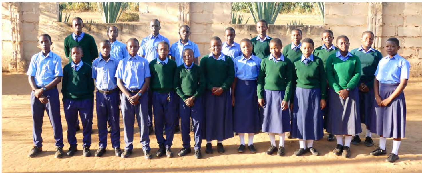
Alle Patenkinder im Mai 2022