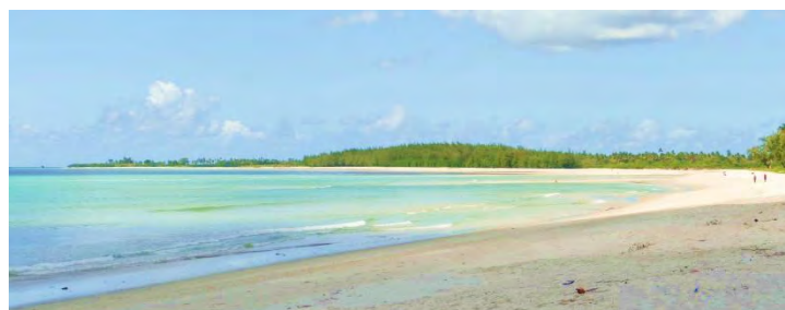
Der Strand von Kipepeo