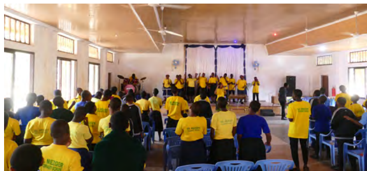
Gottesdienst in der neuen Festhalle

Ab nächstem Schuljahr soll ein lang gehegter Wunsch endlich realisiert werden. Die DMS wird um zwei weiterführende Klassen ausgebaut. Der Abschluss ist dann mit unserem Abitur zu vergleichen. Somit können Schülerinnen und Schüler der DMS die Möglichkeit zum Studium erwerben. Hierfür kann die alte Halle genutzt werden. Diese wurde zu drei Klassenräumen umgebaut.