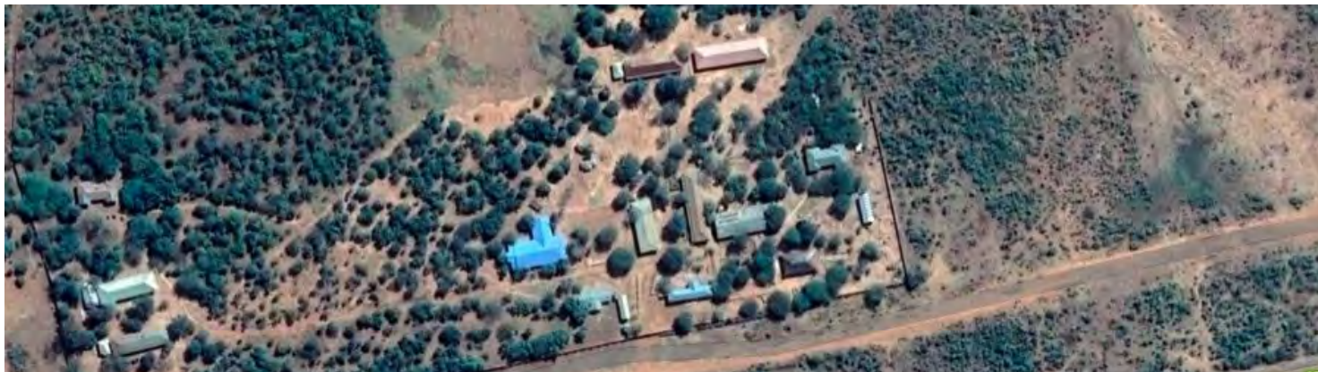
Übersicht zum Schulgelände

Die wirtschaftlichen Bedingungen in Tansania sind so schwer wie nie zuvor.