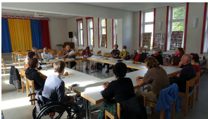
Mitgliederversammlung am 15.10.2022

Ebenfalls seit 1990 unterstützt, hilft und begleitet der „TAYOMI Förderverein e.V.“ die engagierte Arbeit in Tansania. Die in Deutschland Verantwortlichen arbeiten rein ehrenamtlich. Alle Einnahmen und Ausgaben werden gewissenhaft geführt und durch eine Finanzprüfung überwacht.