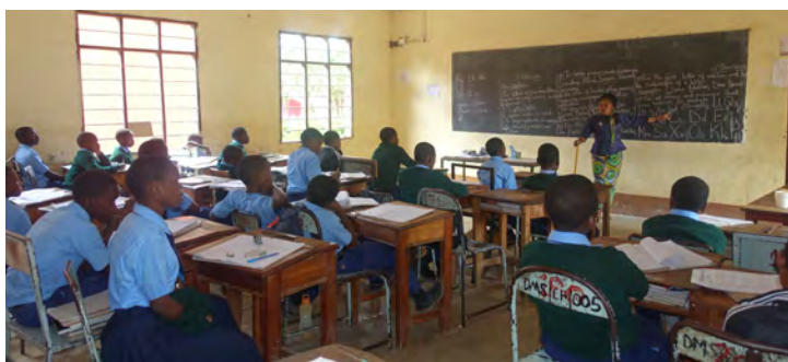
Englisch Unterricht mit Sayuni Tave

Die fehlenden Einnahmen führten unter anderem dazu, dass das Kollegium verkleinert werden musste. Der aktuelle Lehrplan kann von neun Lehrerinnen und Lehrern bewältigt werden.